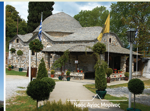
Ναός Αγίας Μαρίας