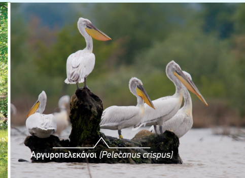
Αργυροπελεκάνοι ( Pelecanus crispus )