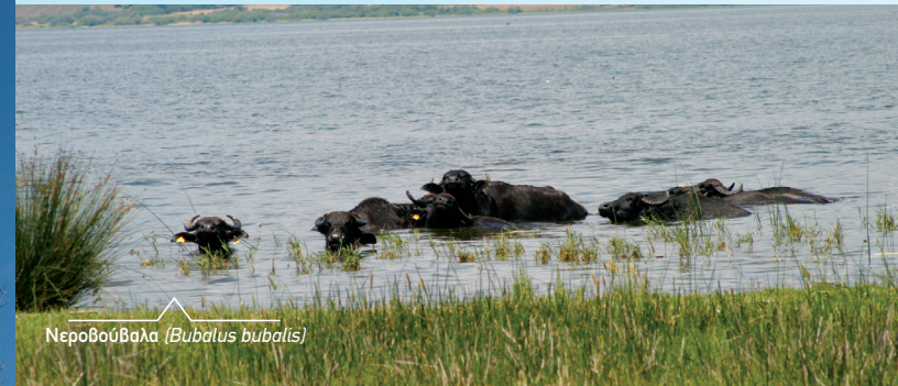
Νεροβούβαλα ( Bubalus bubalis )

Οι ψαράδες χρησιμοποιούσαν μεθόδους αλιείας με κύριο υλικό το καλάμι. Σήμερα, αυτές οι πρακτικές «διαχείρισης» έχουν αλλάξει, οι χρήστες των παραλίμνιων περιοχών έχουν μειωθεί, στην προσπάθεια αποκατάστασης της ισορροπίας της συστήματος.