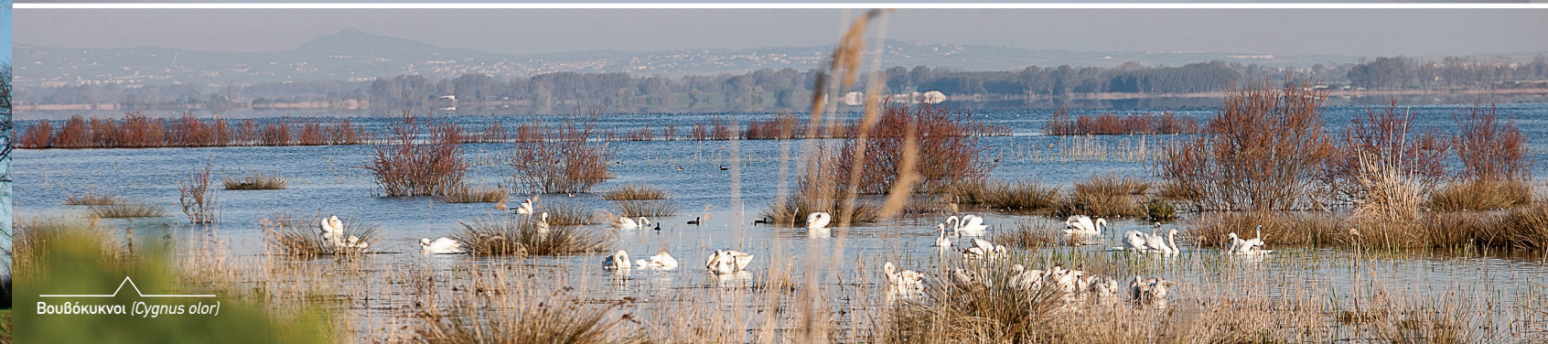
Βουβόκκυνοι ( Cygnus olor )