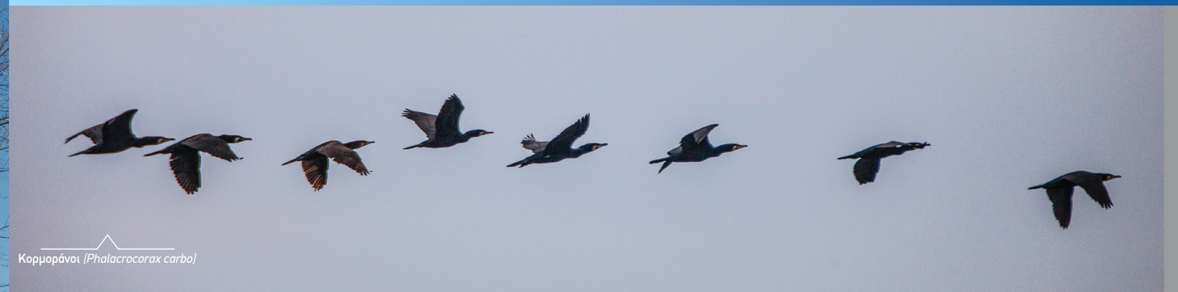
Κορμοράνοι ( Phalacrocorax carbo )